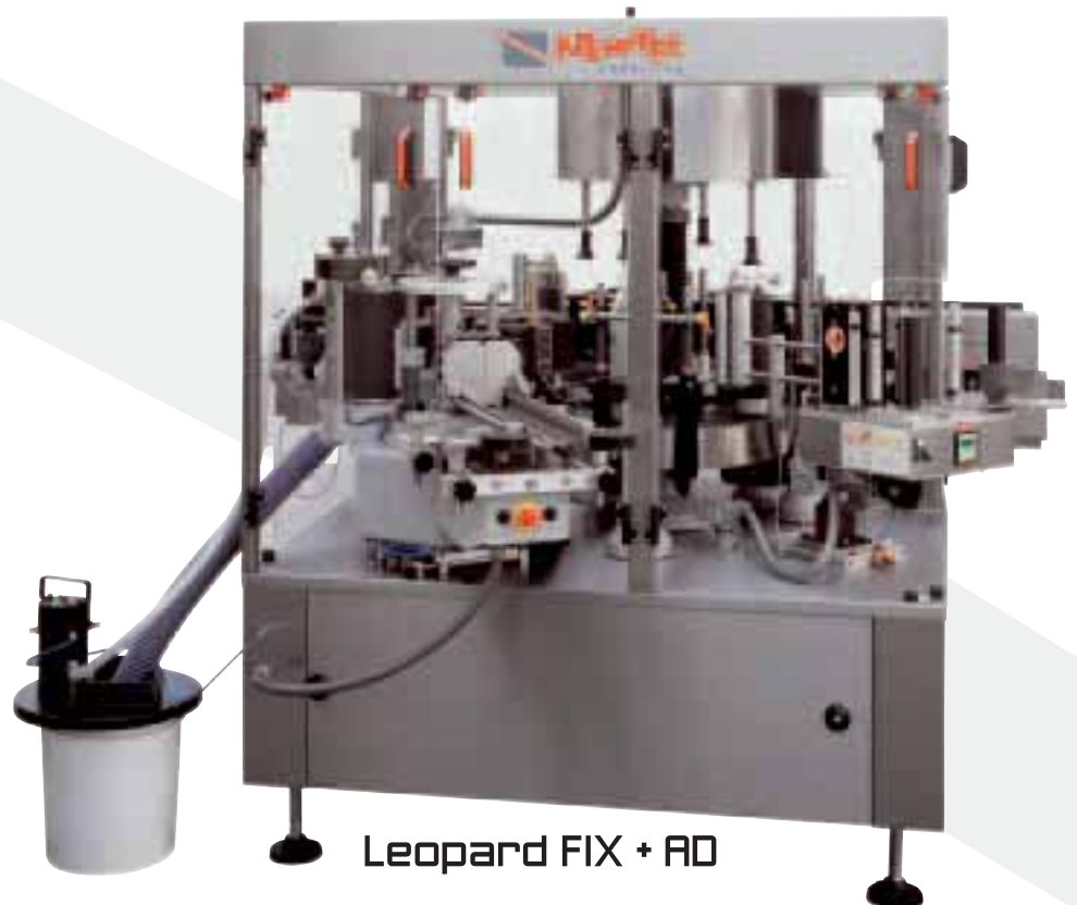
Leopard FIX + RD